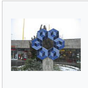
Sculpture de Vasarely à la gare de Budapest-Déli

La fondation Vasarely est une institution à but non lucratif, créée par l'artiste avec son épouse Claire, et reconnue d'utilité publique en 1971. Elle comprend le musée didactique de Gordes (1970-1996) et le centre architectonique d'Aix-en-Provence (1976) 6 ainsi que deux musées « didactiques » à Pécs (1976) et à Budapest (1986).