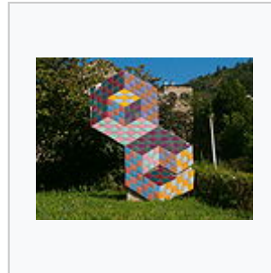
Œuvre de Vasarely devant l'église des Paulins à Pécs.

Les musées Vasarely de Pécs et de Budapest conservent des donations inaliénables ; celui de Pécs possède des œuvres d'autres artistes de sa collection (Soto, Morellet, Yvaral, Claire Vasarely).