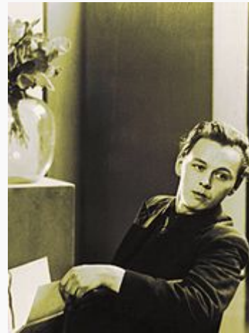
Victor Vasarely vers 1930.